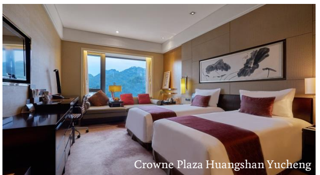
Crowne Plaza Huangshan Yucheng