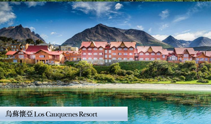
烏蘇懷亞 Los Cauquenes Resort