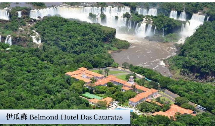
伊瓜蘇 Belmond Hotel Das Cataratas

- 入住 烏蘇懷亞 Los Cauquenes Resort 或同級，位於阿根廷烏蘇懷亞的心臟地帶，周圍環繞著多個引人入勝的地標與景點。