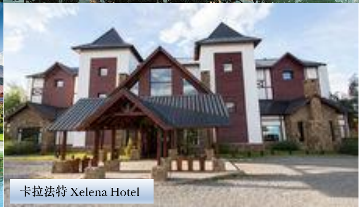
卡拉法特 Xelena Hotel