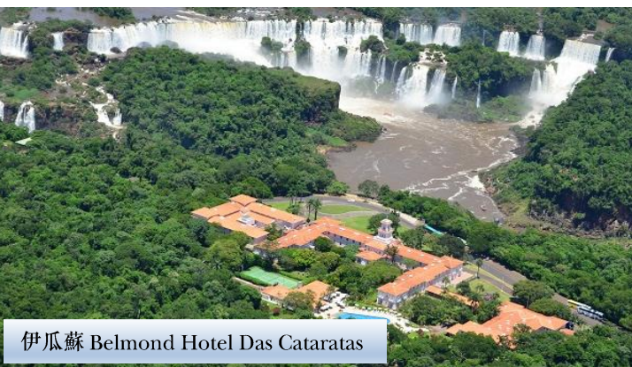
伊瓜蘇 Belmond Hotel Das Cataratas

- 2晚入住烏尤尼 Palacio-de-Sal Hotel 或 Hotel de Sal Luna Salada 或同級。酒店用鹽來打造牆壁及家具，別具特色。