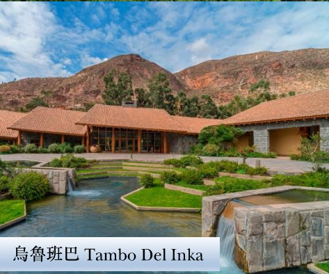
烏魯班巴 Tambo Del Inka