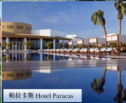
帕拉卡斯 Hotel Paracas