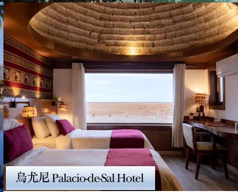
烏尤尼 Palacio-de-Sal Hotel