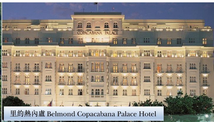
里約熱內盧 Belmond Copacabana Palace Hotel