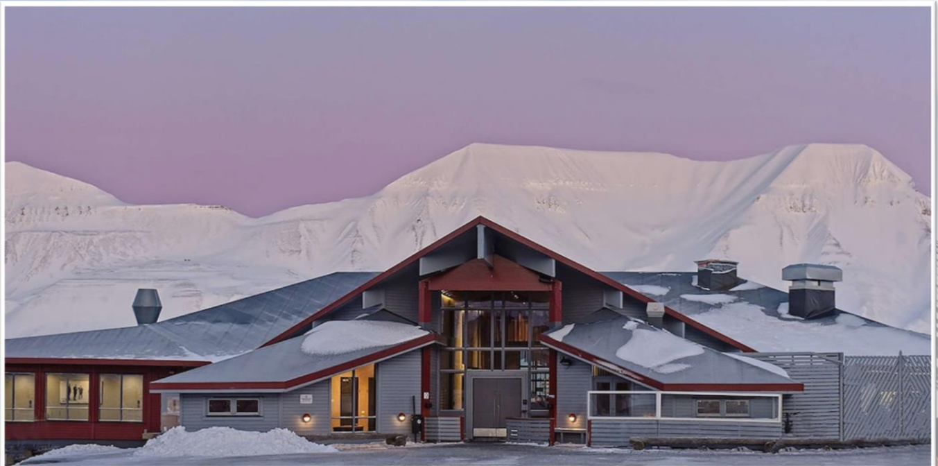
朗伊爾城 Radisson Blu Polar Hotel

是世界上最北端的全方位服務飯店。無論是在飯店餐廳還是戶外，皆可一邊欣賞令人印象深刻的峽灣全景，一邊享用餐點或飲料。