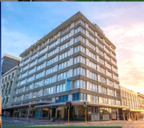
但尼丁 Dunedin Scenic Hotel