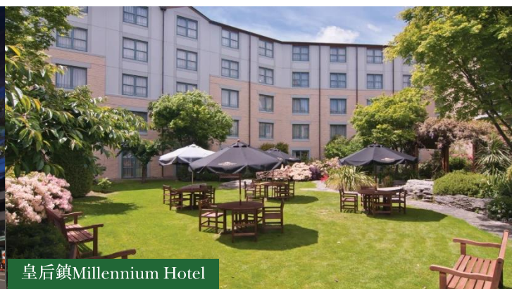
皇后鎮 Millennium Hotel