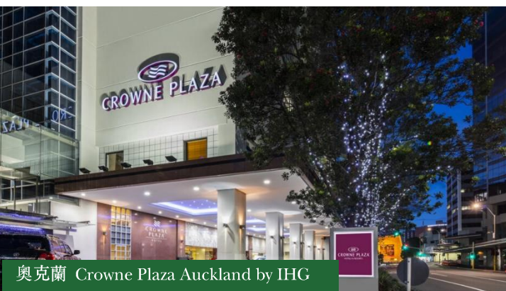
奧克蘭 Crowne Plaza Auckland by IHG

- 基督城 Crowne Plaza Christchurch或同級，酒店位於市中心，擁有現代化的風格和設計，提供符合全球服務標準的酒店住宿，並可飽覽城市及周邊地區的壯麗景色