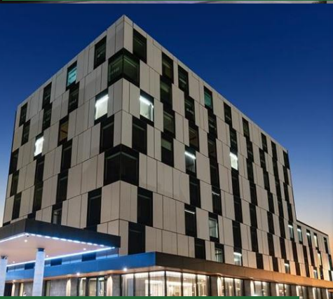
因弗卡吉爾 Distinction Invercargill