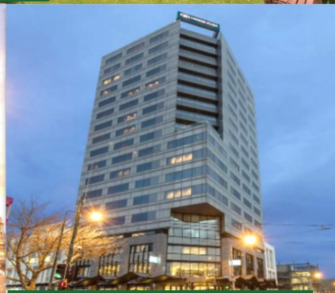
基督城 Crowne Plaza Christchurch