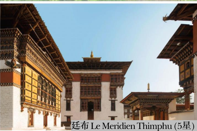
廷布 Le Meridien Thimphu (5星)