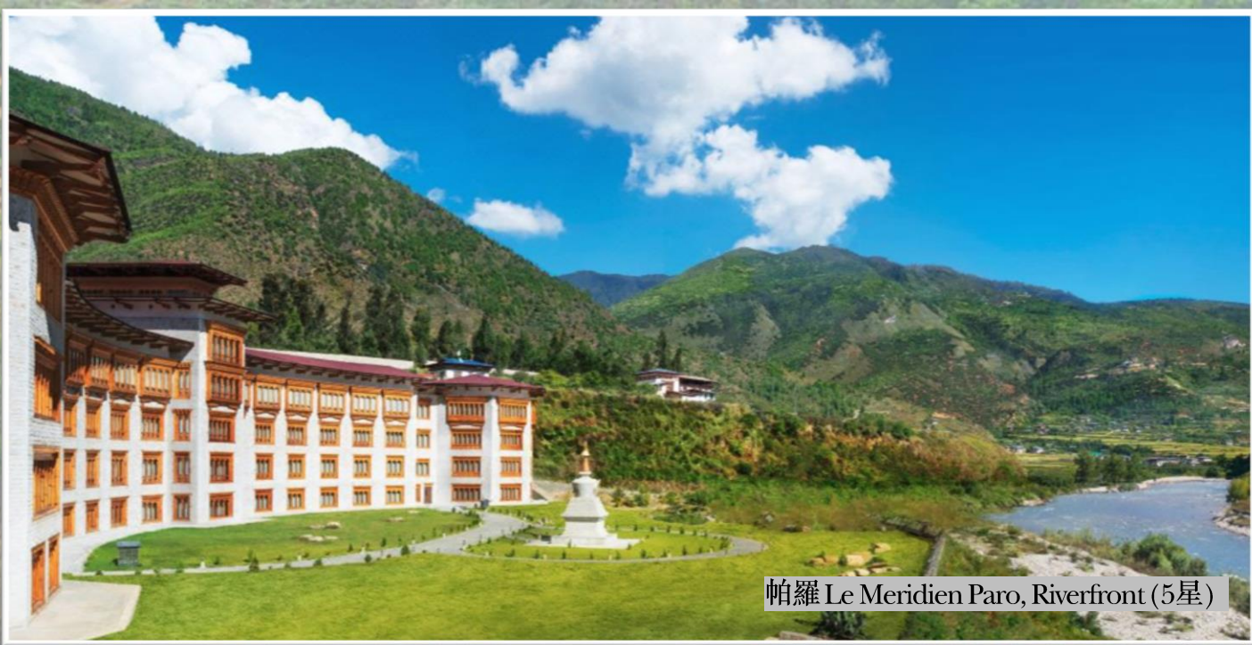
帕羅 Le Meridien Paro, Riverfront (5星)