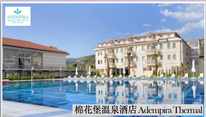
棉花堡溫泉酒店 Adempira Thermal