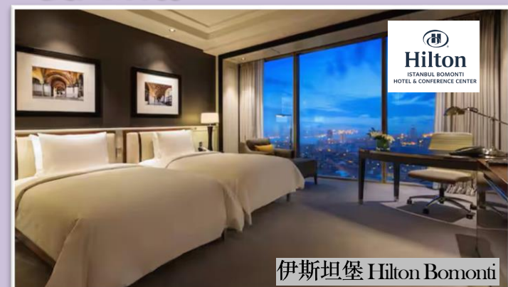
伊斯坦堡 Hilton Bomonti