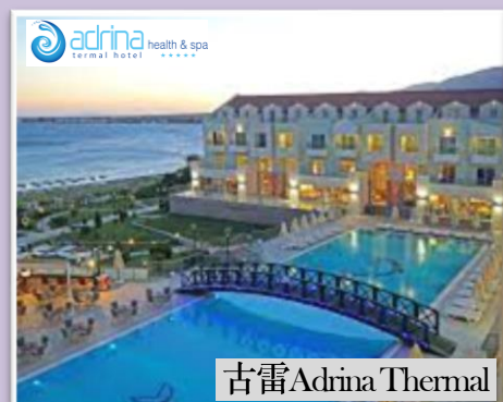
古雷 Adrina Thermal

安排7晚5星，更安排連住3晚伊斯坦堡，市場罕有，享受各具特色風格奢華設施及豪華舒適的住宿環境，高品質的服務，讓旅程更完美。