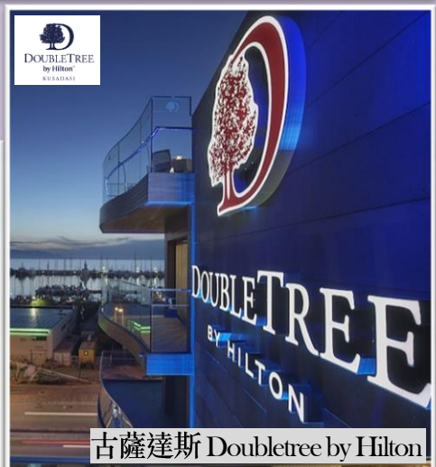
古薩達斯 Doubletree by Hilton