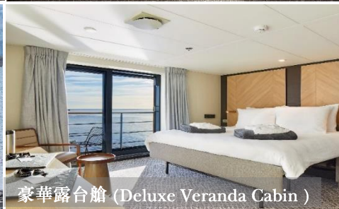
豪華露台艙 (Deluxe Veranda Cabin)