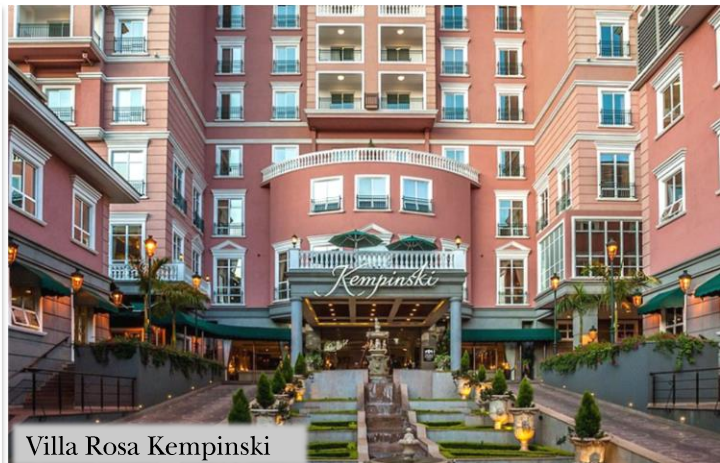
Villa Rosa Kempinski