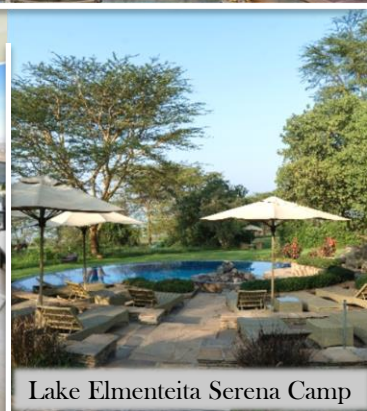
Lake Elmenteita Serena Camp