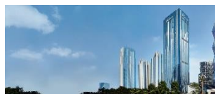
成都5星Fairmont Chengdu Hotel