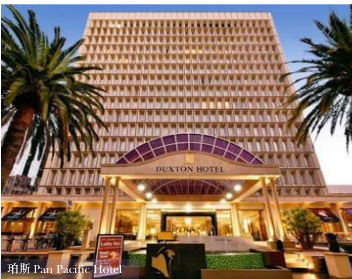
珀斯 Pan Pacific Hotel