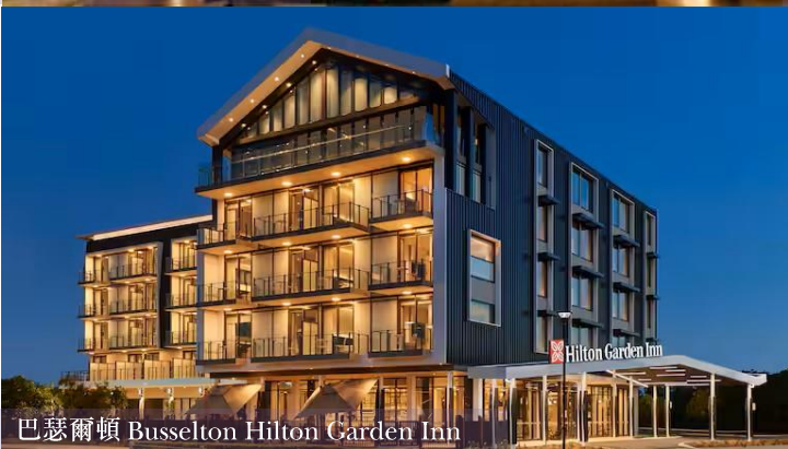
巴瑟爾頓 Busselton Hilton Garden Inn