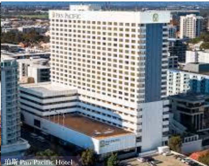
珀斯 Pan Pacific Hotel