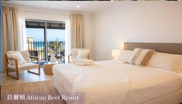
拉爾頓 African Reef Resort