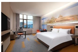
Bavaria Regent Hotel Hailar