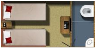
典雅黃金景觀房：第3、5、6、7車廂