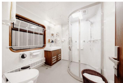
至尊紫金景觀房/雅緻鉑金景觀房: 第10、11車廂