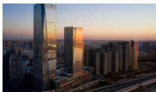
The Ritz-Carlton Harbin