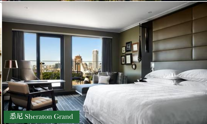
悉尼 Sheraton Grand