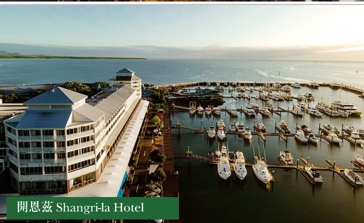
開恩茲 Shangri-la Hotel