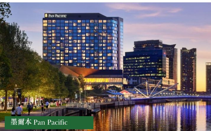
墨爾本 Pan Pacific