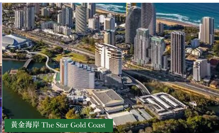
黃金海岸 The Star Gold Coast