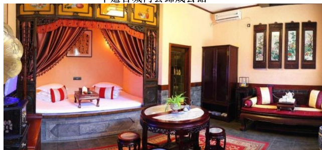
太原Pullman Taiyuan Hotel