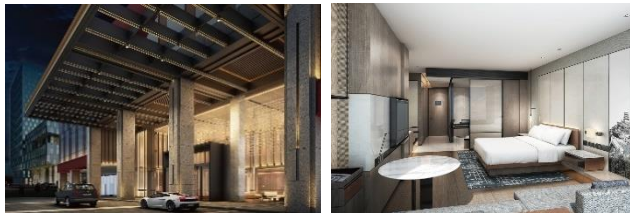
Wuhan Marriott Hotel Optics Valley