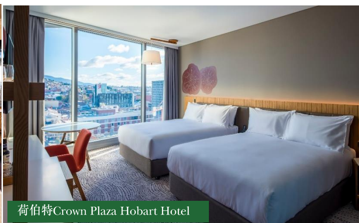
荷伯特Crown Plaza Hobart Hotel