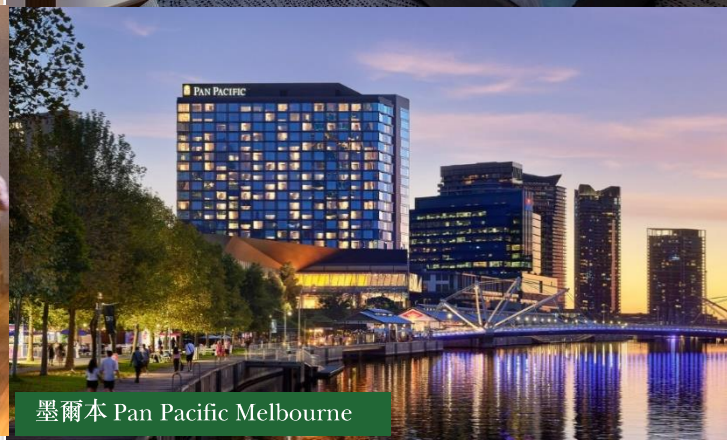
墨爾本 Pan Pacific Melbourne