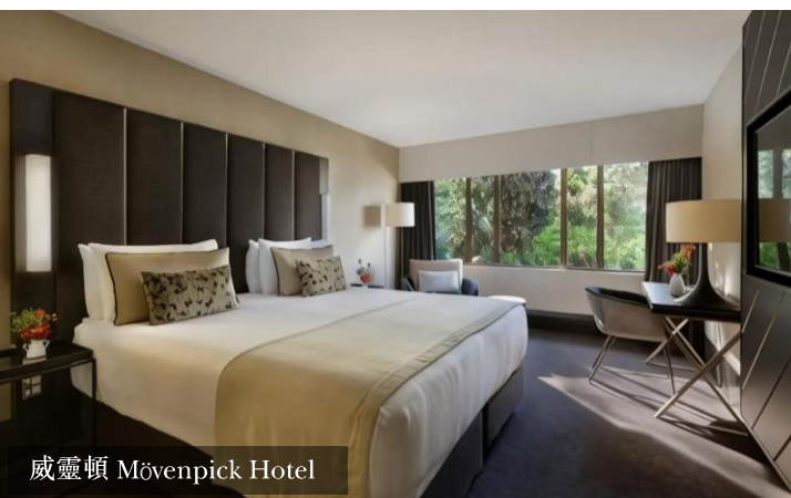
威靈頓 Mövenpick Hotel