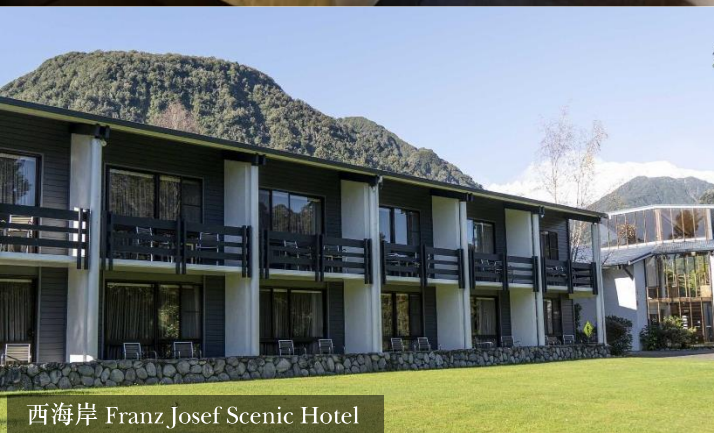
西海岸 Franz Josef Scenic Hotel