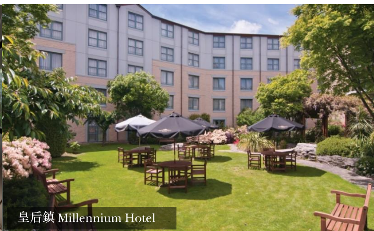
皇后鎮 Millennium Hotel