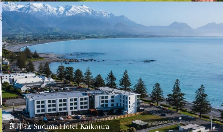
凱庫拉 Sudima Hotel Kaikoura