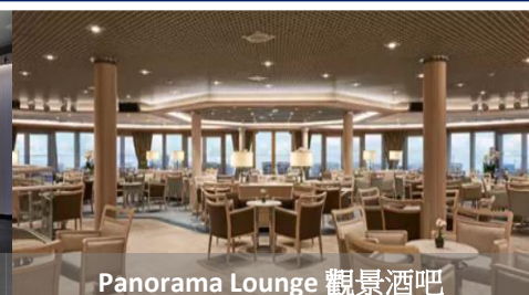
Panorama Lounge 觀景酒吧