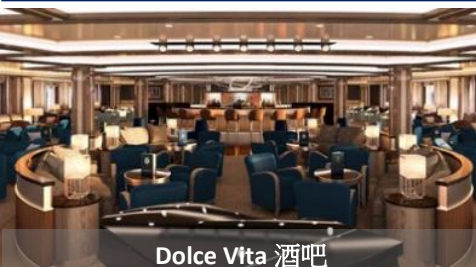
Dolce Vita 酒吧