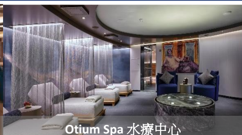
Otium Spa 水療中心