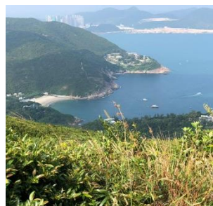
港島健行及古蹟遊