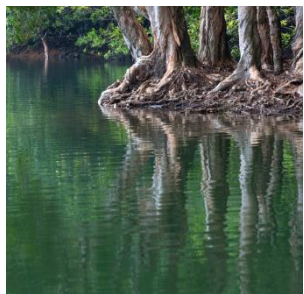
城門郊野公園攝影遊