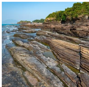
東平洲、吉澳健行遊